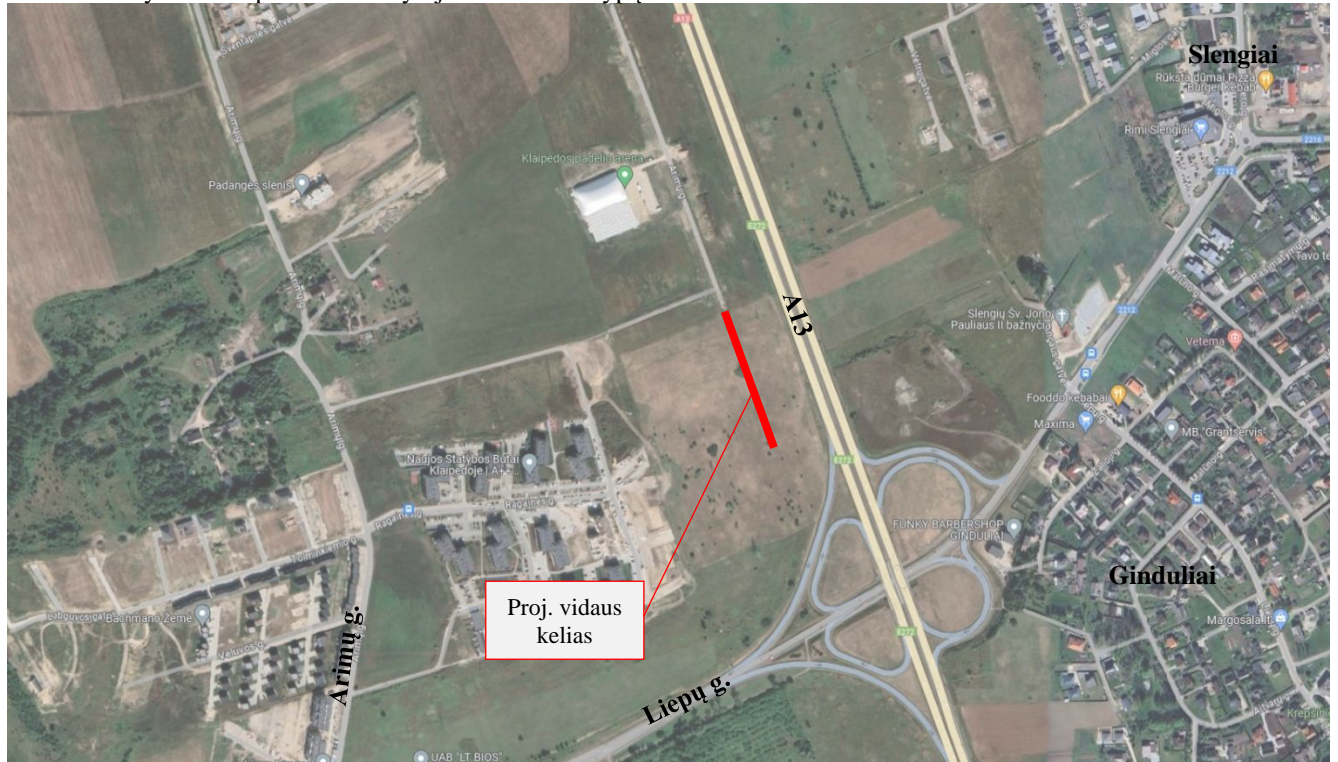
1 pav. Projektuojamo statinio vieta.

Projektuojamas vidaus kelias yra privačiuose sklypuose Kaipėdos mieste. Kelias projektuojamas dviejuose sklypuose, kurie nuosavybės teise priklauso Statytojams Žemės sklypų unik. Nr. 4400-0093-8180 ir 2101-0039-0495.